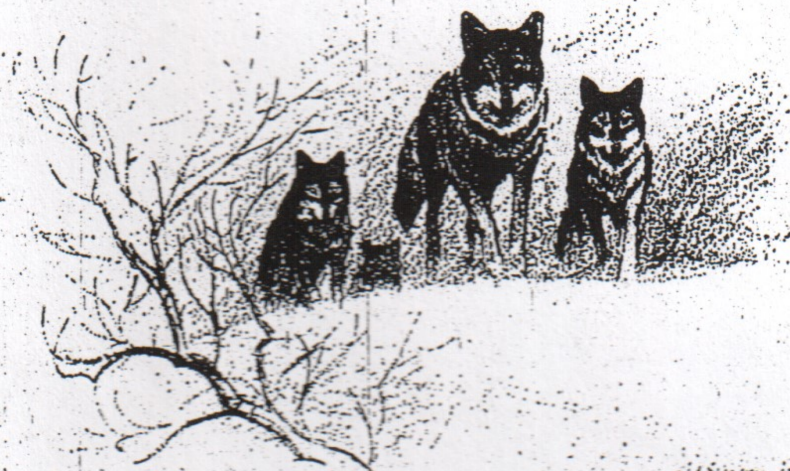
Visionen som är verklighet. Det finns tidvis en vargflock i Mellansverige.

— Eftersom Sverige veterligen bara hade en varg kvar, i Lapplandsfjällen, eftersom Norge understrukt att där inte